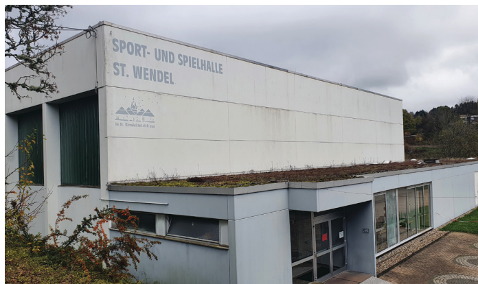
Die alte, inzwischen marode Sporthalle im Sportzentrum. Weil eine dauerhafte Sanierung wirtschaftlich nicht mehr tragbar ist und die Unterhaltung jährlich enorme Summen schluckt, muss jetzt dringend ein Neubau her.

Schon 2014 hatte der Bürgermeister seine Pläne eines Neubaus verkündet. Binnen zwei bis drei Jahren sollte die neue Halle fertig sein. Hier hat sich die CDU in der Planung der Realisierungszeit aber völlig verkalkuliert. Statt realistisch, maßvoll und zweckmäßig zu planen, ging man zum Größenwahn über. Von einer „Eventhalle“ für Großevents oder gar von einem „Olympiastützpunkt light“ war zwischenzeitlich die Rede.